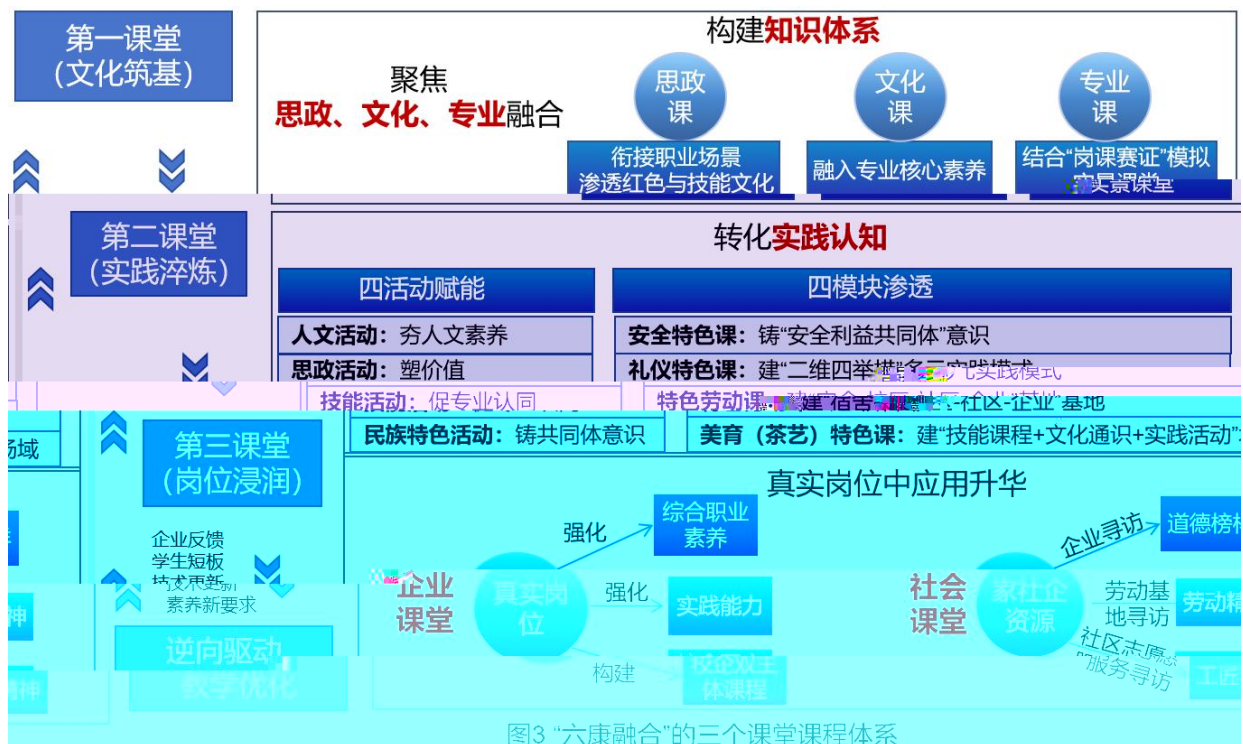
图3 “六康融合”的三个课堂课程体系

一 ( ) 、 、 专业 : 业 , 与 ; 专业 ; 专业 “ ” 。 二 ( ) 人 , 仪 。 三 ( 位 ) 企 业 企 主 体 , 业 。 会 企 。 三 依 、 与 位 , 企业 二 , 一 , 。