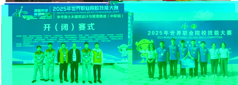
图6 我校代表队参加2025年世界职业院校技能大赛总决赛争夺赛获金奖2项，铜奖11